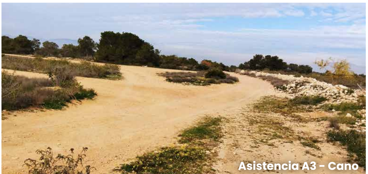
Asistencia A3 - Cano