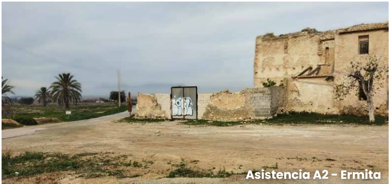
Asistencia A2 - Ermita