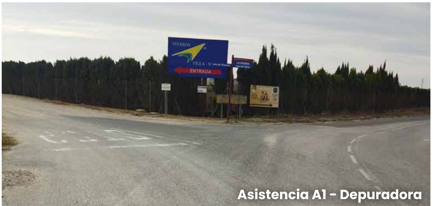
Asistencia A1 - Depuradora